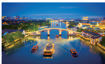
苏州水上旅游发展有限公司