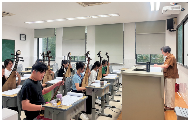
图7 “水韵姑苏班”校内上课现场

2023年9月，经过前期短短一年的接洽、宣传和筹备，以签订三方协议为基础，首届“姑苏水韵班”在学校2020级学生遴选下正式成立，有11位同学顺利进入班级学习，占本届学生人数的五分之一。班级进入实践教学阶段。目前教学秩序正常，学生适应良好。