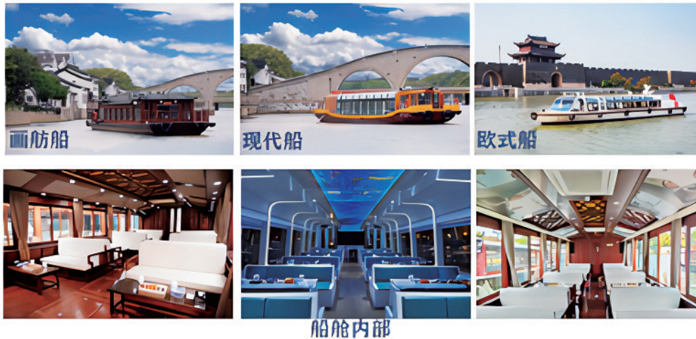
图5 苏州水上旅游发展有限公司旗下各类游船（实训场所）展示