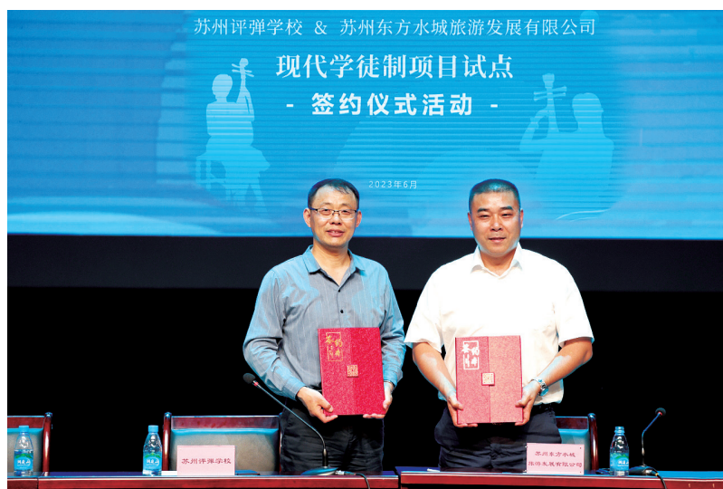
图2. 学校校长和企业董事长签约合影

鉴于企业的未来发展需要大量和稳定的评弹表演人才需求，在多方努力下，苏州东方水城旅游发展有限公司与苏州评弹学校形成了校企合作的发展契机。苏州评弹学校于2021年10月成功申报中国艺术职业教育学会《曲艺表演专业实施现代学徒制的实践探索》项目，在完成前期理论架构的基础上，经过实地考察和调研，最终也将首批合作的橄榄枝伸向了苏州东方水城旅游发展有限公司。公司方当即成立项目运营小组，积极配合学校进行项目研究和实际操作的落地。2022年10月—2023年5月间，校企双方负责团队成员密切联系，充分沟通，经过共同探讨，一致确定最后的合作方向——在2020级学生中成立“水韵姑苏”试点班。2023年6月，完成校企合作协议的签订，以开启“水韵姑苏”现代学徒制试点班的运行。