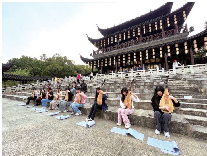
图8 “水韵姑苏班”校外实训场景展示