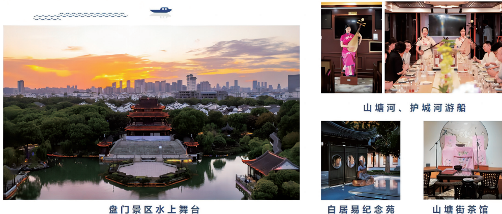
图6 盘门景区及其他实训基地展示