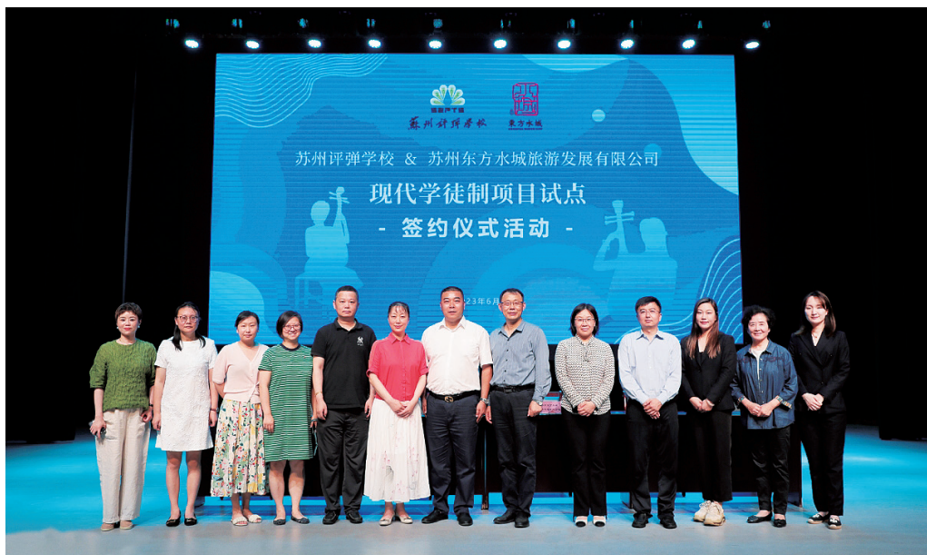
图3 水韵姑苏项目组成员签约仪式合影