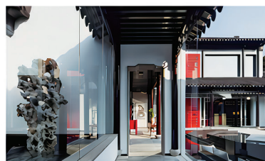
苏州古运河旅游有限公司