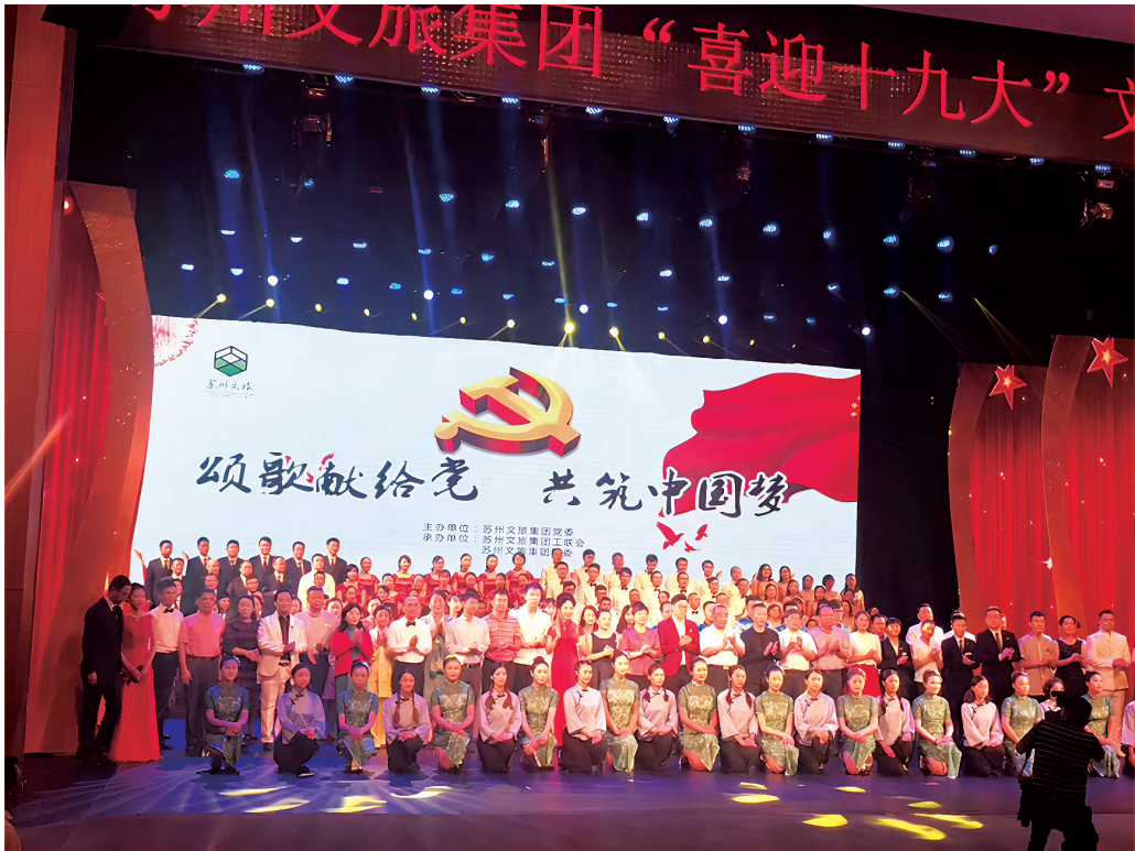
图4 企业导师团队在“苏州文旅集团“喜迎十九大”文艺汇演中荣获三等奖”